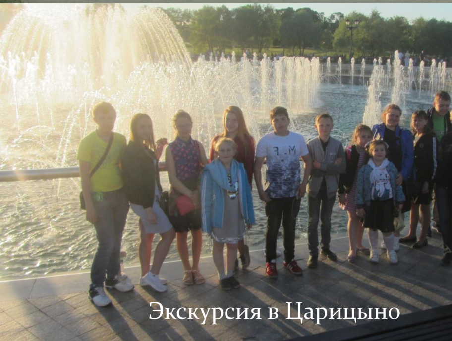
Экскурсия в Царицыно